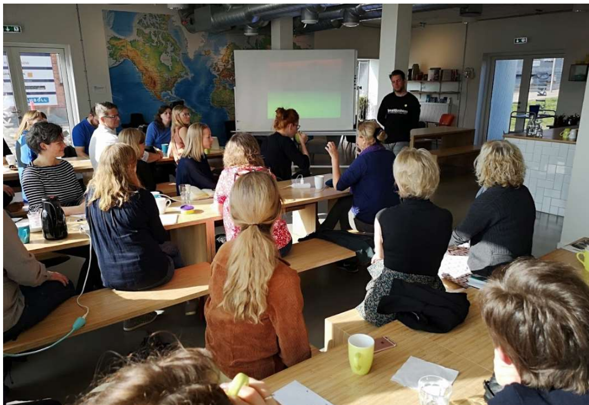
Billede ovenfor: Morgen på Fabrikken-arrangement på Jessens Mole 11