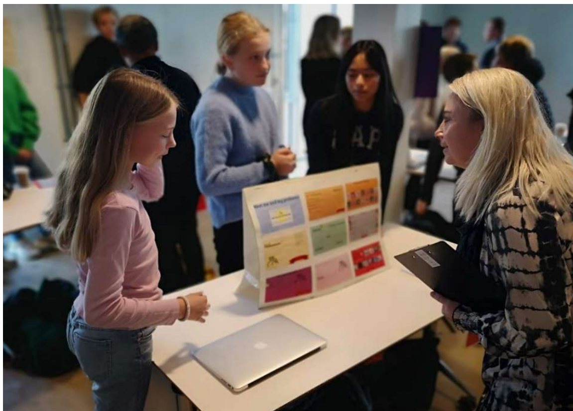
Billedet ovenfor: Lokalefinale Projekt Edison nov. 2019.