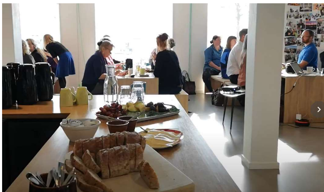
Billedet ovenfor: Stemning i caféen på Jessens Mole.