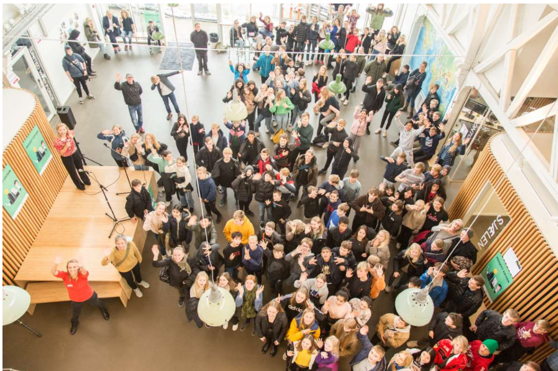
Billedet ovenfor: 1. nov. 2019 afholdte Fremtidsfabrikkerne lokalfinale i opfinderkonkurrencen Projekt Edison – knap 200 elever fra 7. klasser i Svendborg dystede om at gå videre til den nationale finale i Fredericia, arrangeret af Fonden for Entreprenørskab.