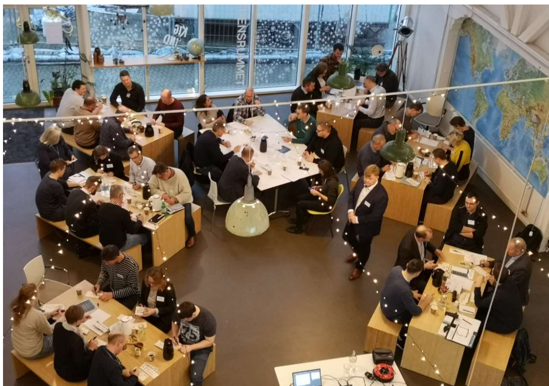
Billedet ovenfor: Vin og Workshop-arrangement for it- og maritime virksomheder med projekt ShareFifty5 – januar 2020